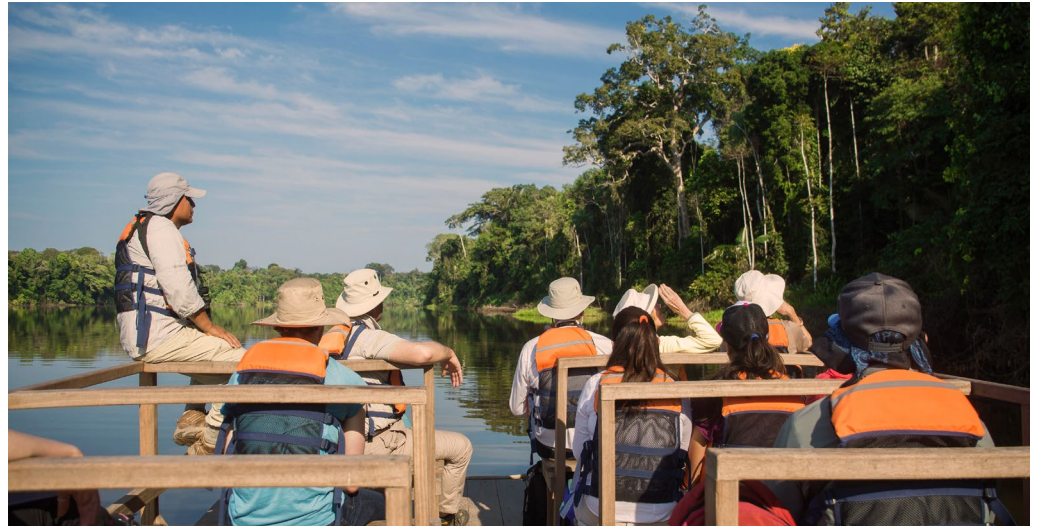
Actividad ecoturística en el Lago Tres Chimbadas, Comunidad Nativa de Infierno, Madre de Dios, Perú.

Una herramienta para la gestión participativa y el desarrollo sostenible del territorio